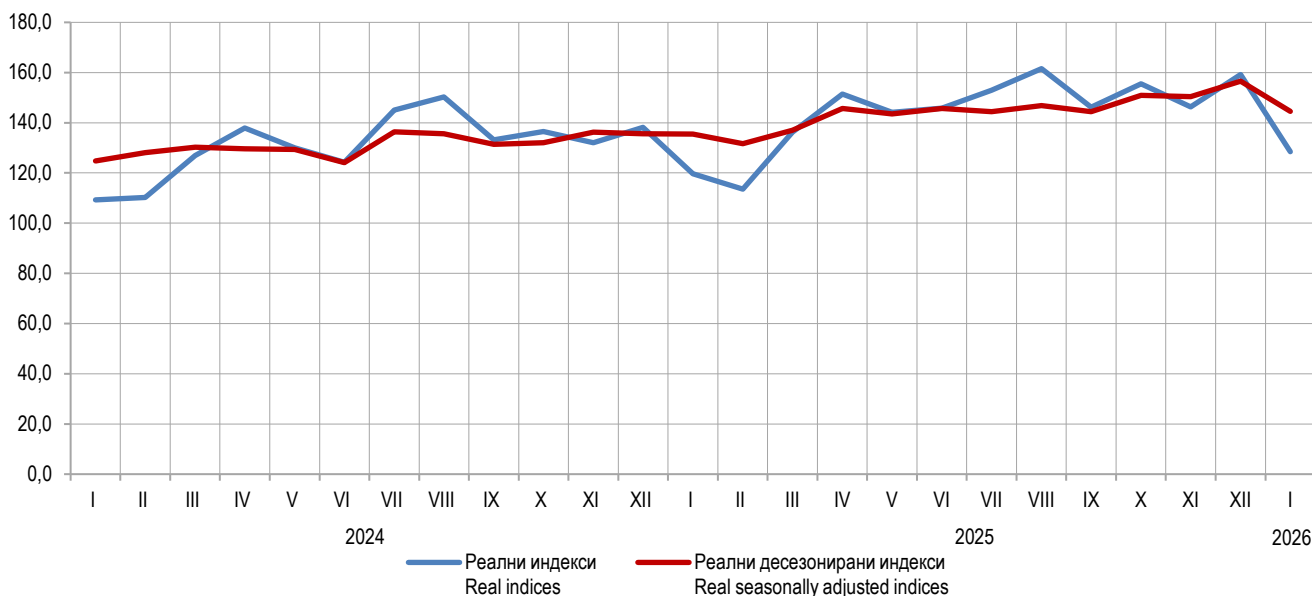
Графикон 1. Серија реалних неприлагођених и реалних десезонираних индекса, 2021=100 Graph 1. Series of real non-adjusted and real seasonally adjusted indices, 2021=100

Turnover refers to the value of goods sold and services performed during the reference month. Turnover does not include value added tax (VAT).